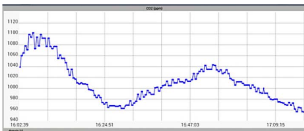
Beispiel einer Langzeitaufzeichnung der CO 2 -Konzentration in einem geschlossenen Raum

Eine Android™-App steht ebenfalls zur Verfügung um die Daten in Echtzeit auf mobilen Endgeräten darzustellen.